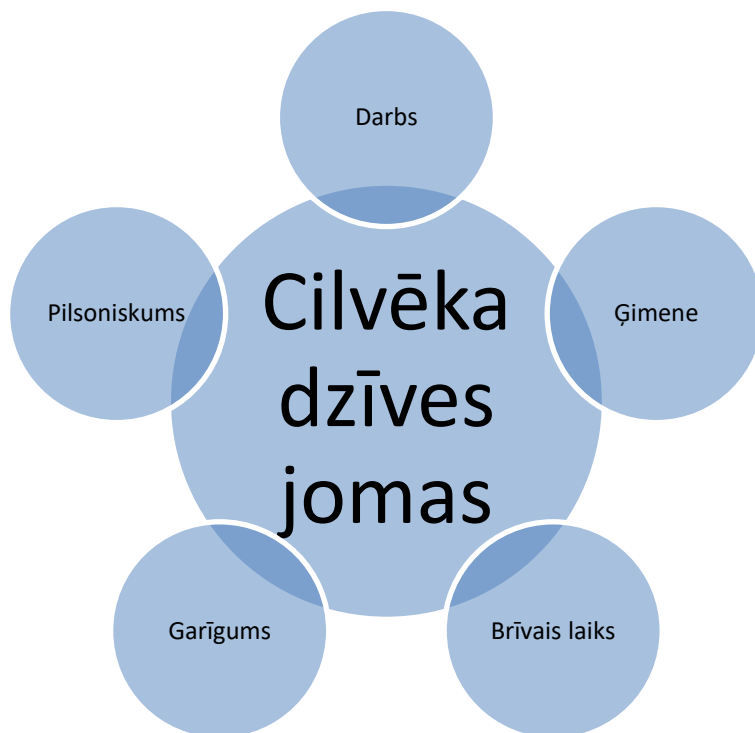
1. diagramma, Cilvēka dzīves jomas

Mūsdienās, gluži kā personības attīstība, arī karjeras veidošanas process attīstas un pilnveidojas visa mūža garumā. Indivīdam veidojot savu karjeru, svarīgi ir apzināties savus vēlamos dzīves mērķus, lai efektīvāk un mērķtiecīgāk pilnveidotu savas kompetences. Karjera un tās attīstība ir nepārtraukts, mērķtiecīgs un jēgpilns process, kurš norit visa mūža garumā, balstoties uz mūžilgu izglītošanos un sevis veiksmīgu realizēšanu dažādās dzīves jomās (skatīt 1. diagrammu). Veiksmīgas karjeras pamatā ir cilvēka dzīves jomu harmoniska attīstība un piepildījums tajās.